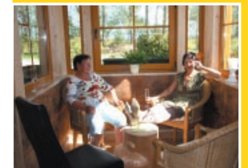
Anbau für kalte Wintertage