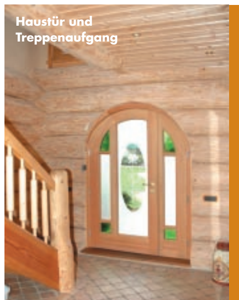
Haustür und Treppenaufgang