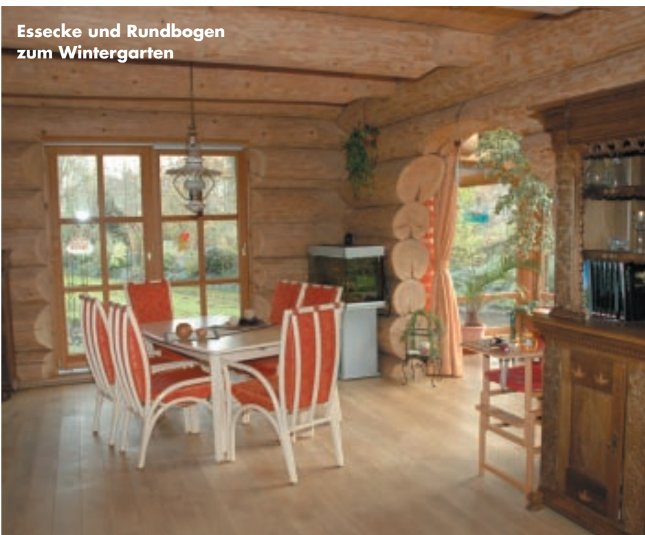
Essecke und Rundbogen zum Wintergarten