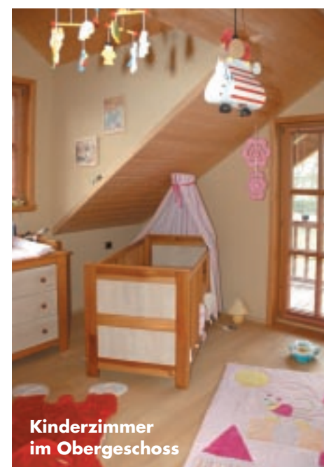
Kinderzimmer im Obergeschoss