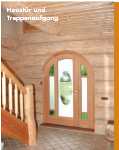
Haustür und Treppenaufgang