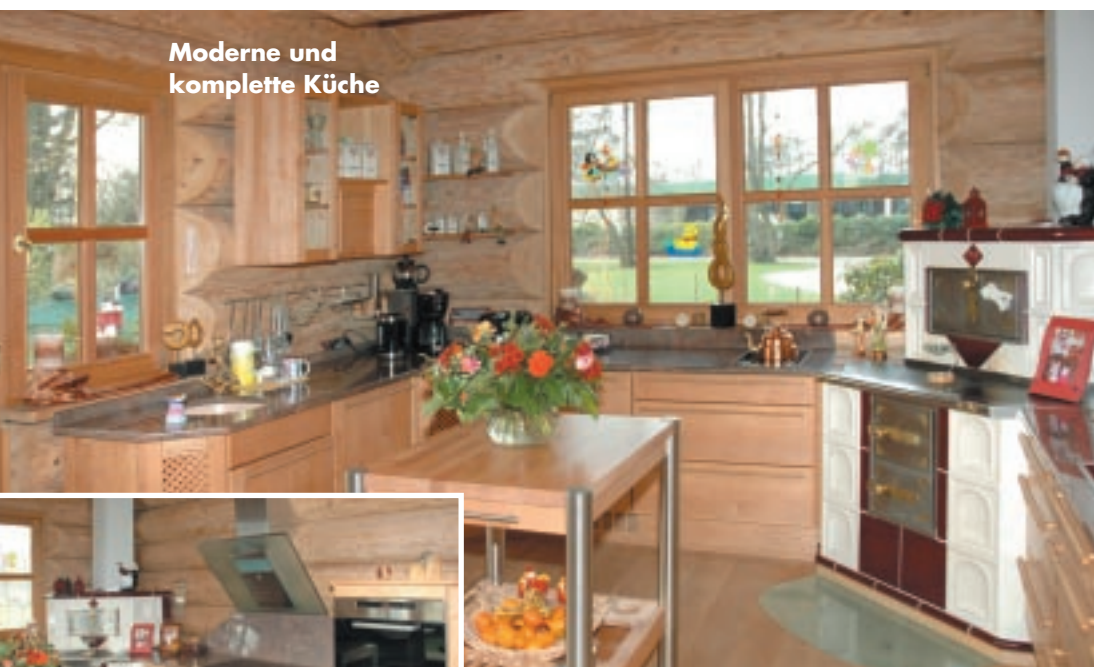
Moderne und komplette Küche

Löffler Naturstammhaus Liebensteiner Straße 39 D-93599 Brotterode Telefon 0049-(0)36840-30760 Internet www.loeffler-naturstammhaus.de