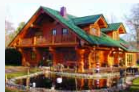
Weisstannen-Blockhaus an der Nordsee.