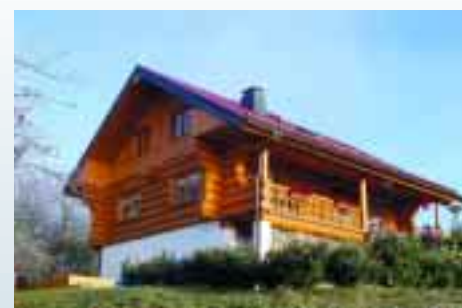
Fichten-Blockhaus in Bad Salzungen.