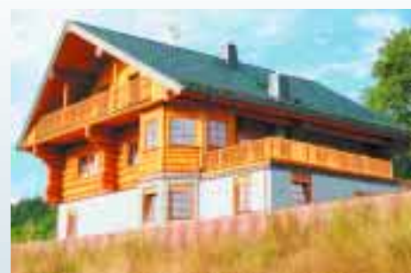
Blockhaus mit Erker in Trusetal.

Ein besonderes Merkmal der Firma Löffler Naturstammhaus ist die Möglichkeit, Häuser in Vollmontage anbieten zu können. Dies gelingt über eine Kooperation zwischen den Handwerksbetrieben im Ge-