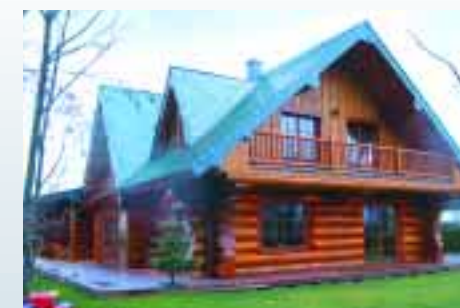
Douglasien-Blockhaus an der Ostsee.