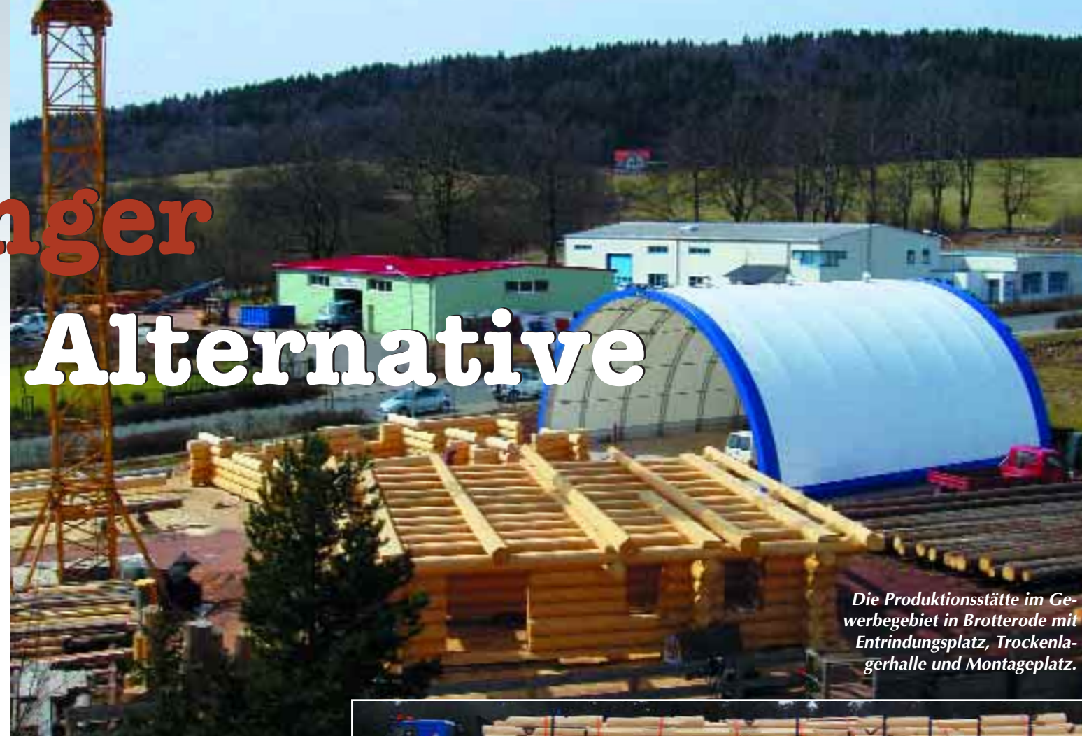
Die Produktionsstätte im Gewerbegebiet in Brotterode mit Entrindungsplatz, Trockenlagerhalle und Montageplatz.

Im Anschluss an diese Ausbildung wagte er unmittelbar den Schritt in die Selbstständigkeit. Er ging zurück nach Thüringen und baute dort mit geringen Eigenmitteln sein privates Musterhaus. Im Gewerbegebiet von Brotterode wurde alsbald der Produktionsstandort etabliert. Hier fertigen 5 Mitarbeiter jährlich 6 bis 7