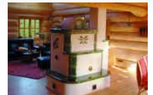
Solitär-Heizung im Naturstammhaus.

Naturstammhäuser verlangen nicht nur eine sachgerechte Herstellung, sie verlangen auch nach einer schönen Gestaltung. Dies ist ein wichtiges Anliegen der Firma Löffler, dem sie in Zusammenarbeit mit einem spezialisierten Planungsbüro gerecht wird. Das Resultat kann sich sehen lassen. Die Referenzliste besonders gelungener Beispiele wie sie an der Ostseeküste, im Westerwald, Hunsrück oder Schwarzwald stehen, ist groß. Und nicht nur von der Ferne sehen diese Objekte gut aus. Auch die Details, wie Dachan-