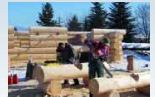
Winterproduktion im kalten Thüringen.

werbegebiet Brotterode, die diesen Trend zum ‘vollständigen’ Bauen bereits frühzeitig erkannt hatten. Innerhalb der ersten 6 Jahre wurden immerhin von den ca. 30 gelieferten Naturstammhäusern 10 ‘komplett’ dem Bauherrn übergeben.